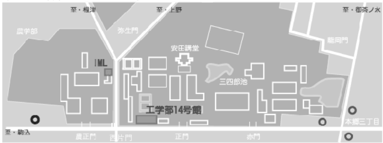
東京大学 本郷キャンパス・工学部14号館